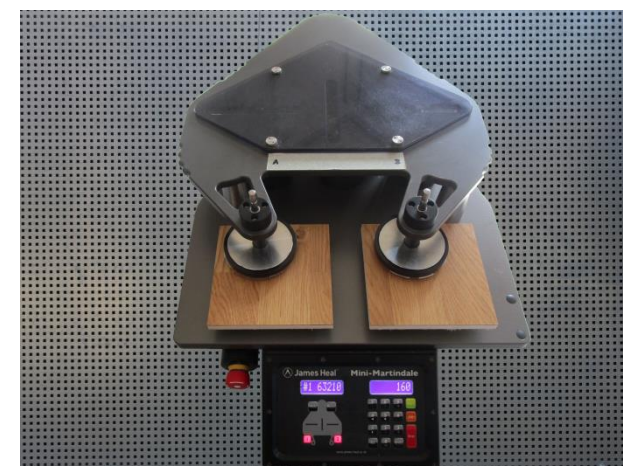
Martindale abrasion y pilling tester